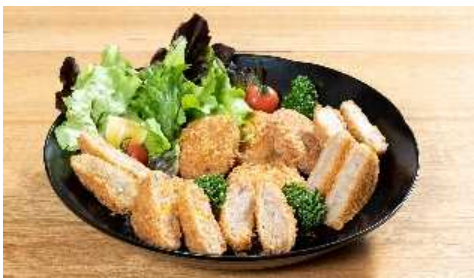
開発されたサツマイモコロッケ、レンコンメンチなど

開発された加工品について、今後、一般販売も視野に入れ、養殖コイの消費拡大をめざしていきます。