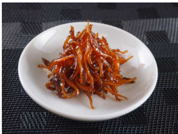
農林水産大臣賞 「しらうお佃煮」