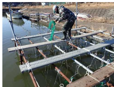
採卵した卵を付着させたキンランを垂下

近年、特に北浦においてワカサギ資源が著しく減少していますが、ワカサギ資源を守るため、漁業者による取り組みが毎年続けられています。