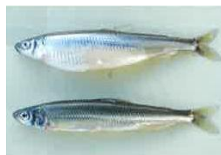
ワカサギ親魚 （上:メス 下:オス）