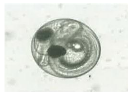
ふ化直前のワカサギの卵 （直径約1mm）