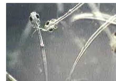
ワカサギのふ化稚魚 （体長約5mm）