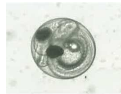
ふ化直前のワカサギの卵 （直径約1mm）