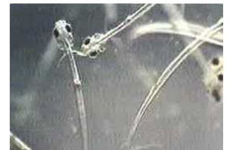
ワカサギのふ化稚魚 （体長約5mm）