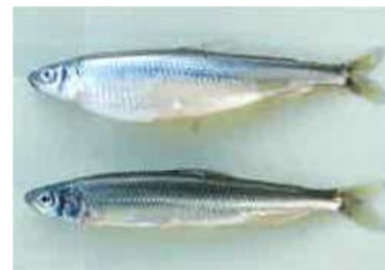
ワカサギ親魚 （上:メス 下:オス）